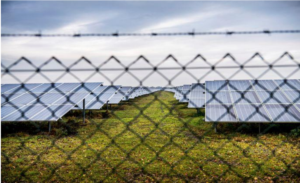
Zonnepark bij Sappemeer.

Opvallend vaak zijn het buitenlandse investeringsfondsen die een Nederlands zonnepark opkopen. Zoals het Duitse Blue Elephant Energy (BEE), waar de grote verzekeraar Gothaer Insurance Group achter schuilgaat. BEE ('Wij maken de wereld elke dag een beetje schoner en mooier') kocht in juli 2017 het zonnepark Groene Hoek in Hoofddorp. Sindsdien heeft het in Hamburg gevestigde bedrijf nog twaalf andere zonneparken opgekocht, waaronder in Veendam, Andijk en Lelystad. De komende jaren wil BEE 1,1 miljard euro investeren in zonneparken. Dat geld komt behalve van de Gothaer Group grotendeels van particuliere beleggers.