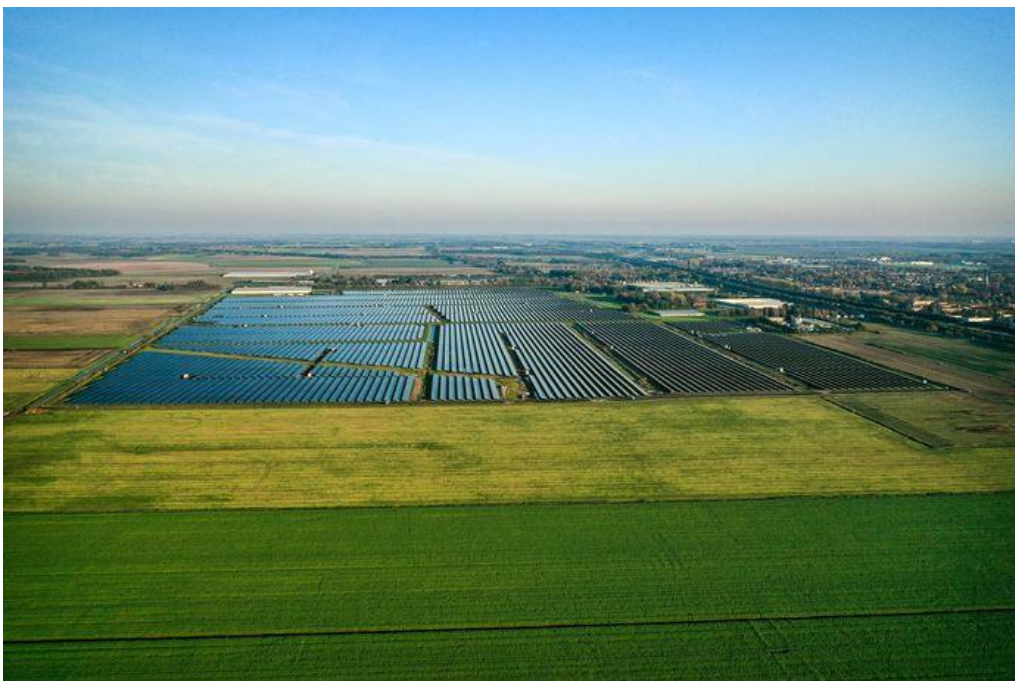
Het Zonnepark Midden-Groningen bij Hoogezand-Sappemeer.